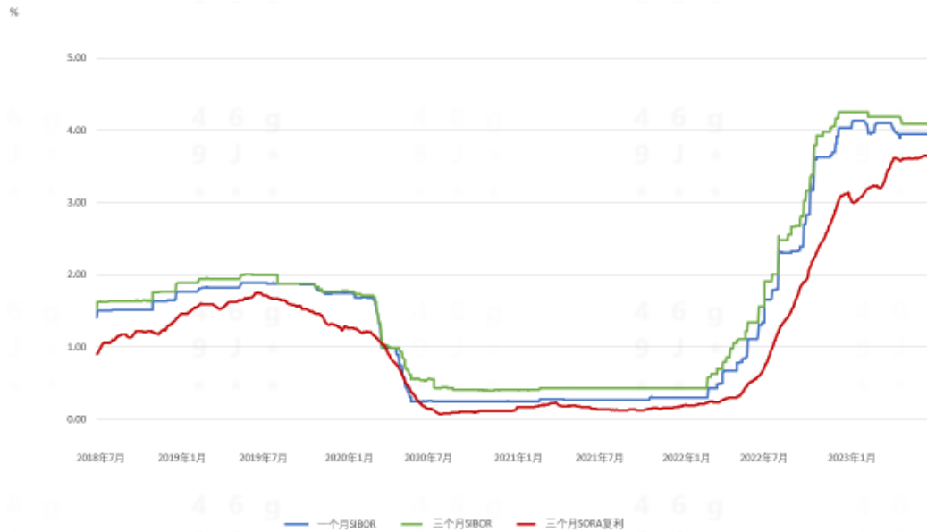
图二：一个月SIBOR、三个月SIBOR和三个月SORA复利与以往走势的比较